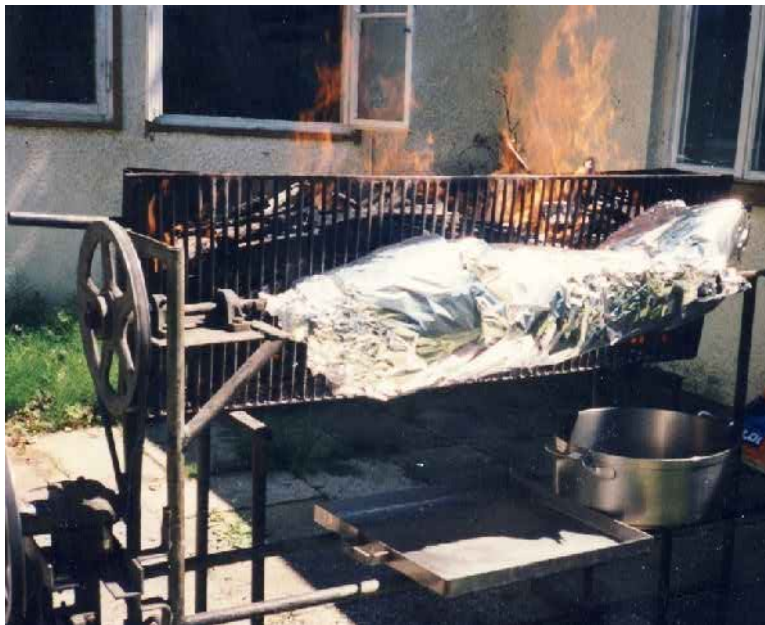
Grillfest im Bürgerpark