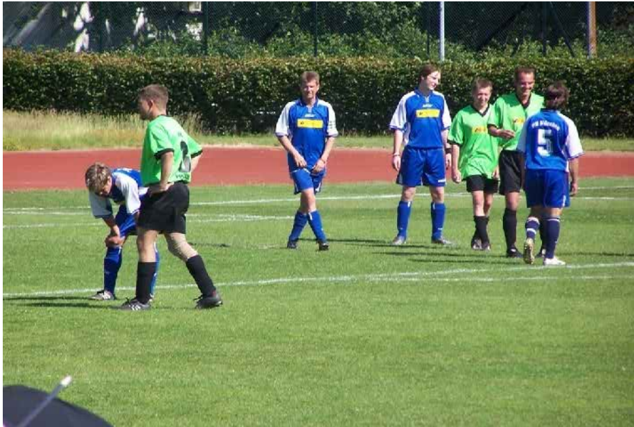
Postbank Cup 2005 in Berlin