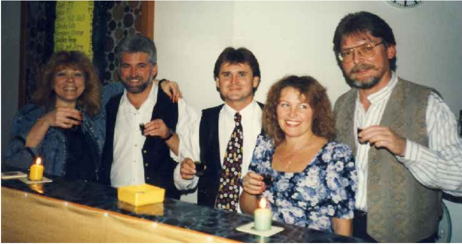
v.l.: Wunderer, Henker, Ulraum, Meiler, Haupt