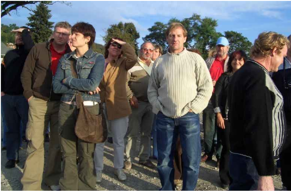
v.l.: xxx, xxx, xxx, Ronneburg A, B, Kawinsky, Reiseführer, Freundorfer, Schrötz